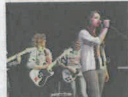
Les jeunes seront sur scène le 4 novembre.

Les inscriptions sont terminées. Il reste maintenant à réserver son samedi 4 novembre après-midi pour assister au concours des Jeunes Talents du Bergeracois, qui se tiendra au centre culturel Michel-Manet. Pour rappel, cette initiative portée par la Communauté d'agglomération bergeracoise (CAB) est réservée aux jeunes âgés de 12 à 25 ans, qui désirent monter sur scène pour montrer ce qu'ils savent faire : du sport, du chant, de l'humour... Peu importe, pourvu que l'envie soit là.