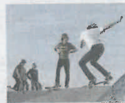
Skateboard et cultures urbaines à Pessac, jeudi. « SO »

par la Communauté d'agglomération bergeracoise (CAB), différentes animations sont proposées pendant ces vacances de la Toussaint. La semaine prochaine, une dizaine d'activités sont ainsi organisées, dont une sortie, jeudi 2 novembre, au skatepark de Pessac (33), pour des ateliers liés aux cultures urbaines : lasertag, escalade, boxe, hoverboard, street soccer, breakdance... Quant aux autres activités qui ryth-